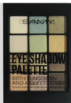
3. MAYAN SANDS