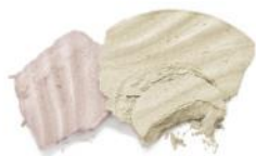
1. DIAMOND GLOW