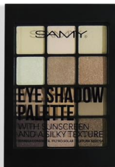
2. PERSIAN DESERT