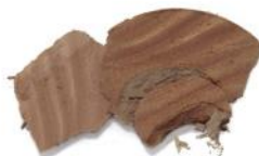
1. TAN GLOW