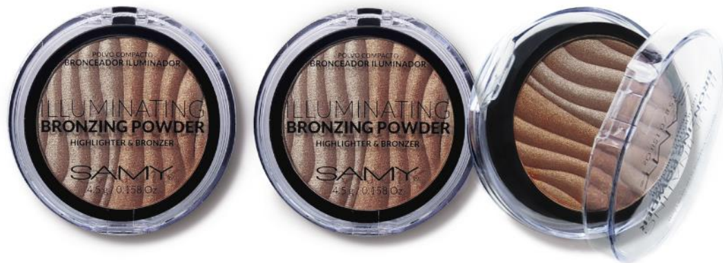
1. PEARL BRONZE