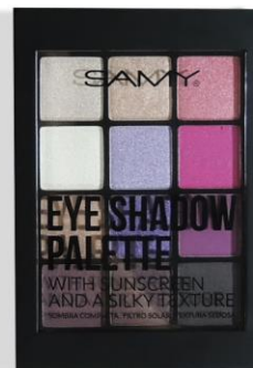
6. MING GARDEN