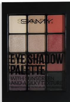
5. ARABIAN NIGHTS